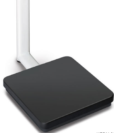
KERN MPB-P mit Stativ