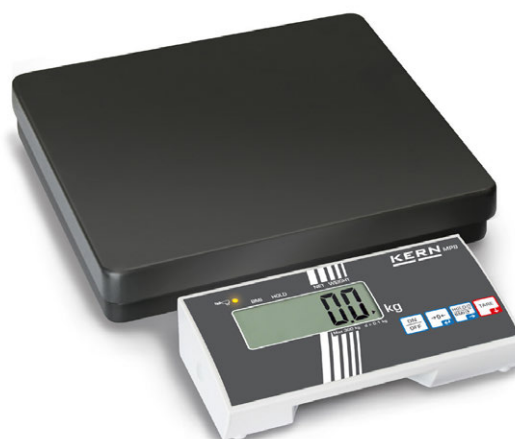
KERN MPB mit freistehendem Auswertegerät